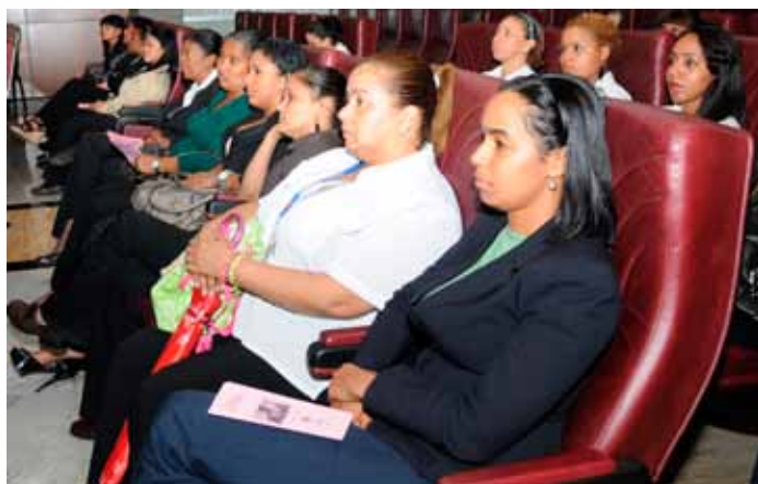
Parte del público.

Luego de la sesión de preguntas y respuestas, se habló sobre la cantante Soraya Raquel Lamilla Cuevas (Nueva Jersey, Estados Unidos, 11 de marzo de 1969 - Miami, 10 de mayo de 2006), más conocida sólo como Soraya, a quien lamentablemente el cáncer de mama segó su vida en la flor de su juventud y de su éxito y se proyectó un video de ella cantando una canción de esperanza.