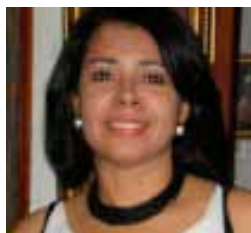
Por Zobeyda Cepeda

La escuela debe diseñar e implementar programas que promuevan relaciones igualitarias y valores de respeto ausentes del machismo violento y asesinator. Enseñar la utilización de lenguaje incluyente, no sexista; junto a la familia, la formación de la personalidad sin encajar en parámetros sexuales. A soltar los mecanismos de control aprendidos así como los de codependencia para aprender a vivir la humanidad en plenitud y libertad independientemente del sexo.